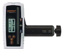
SensoLite 410 Set con soporte universal + pila