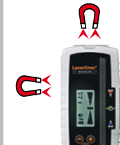
Imanes en la parte frontal y lateral