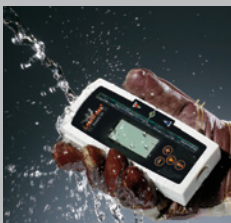
Estanco al agua y el polvo según clase IP 67