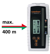
Para láser rojos y verdes max. 400 m