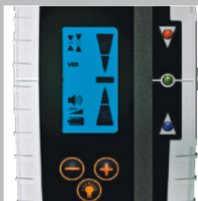
Pantalla LC iluminada, LED de indicación super brillantes